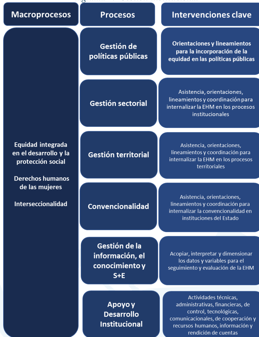
Diagrama 1. Gestión institucional